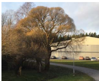
Marraskuinen Terijoen salava.

kakirveelle ja Kaerlaan nimikkopuiksi valikoitui Terijoen salava. Nimikkoperennaksi valikoitui "Särkynytsydän" ja pensaaksi oudompi ja myrkyllinen "Euroopansorvaripensas".