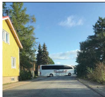
Riitasuonkadulla vaarallinen peruuttelu on arkipäivää.

jalkakäytävää, jolloin sen ja tien väliin saataisiin teräksestä bussin pysäyttävä ajonestoaita. Jalkakäytävän leventäminen ei kaventaisi ajorataa, koska toisella puolella on asfaltti ja sitä voitaisiin jatkaa Ruskonpuiston suuntaan. Jos rakennetaan aita, jalkakäytävää on leventettävä koneellisen talvikunnossapidon vuoksi. Oman lusikkansa soppaan tuo Pohjoiskaaren liikenneympyrä, jonka rakennus alkanee keväällä.