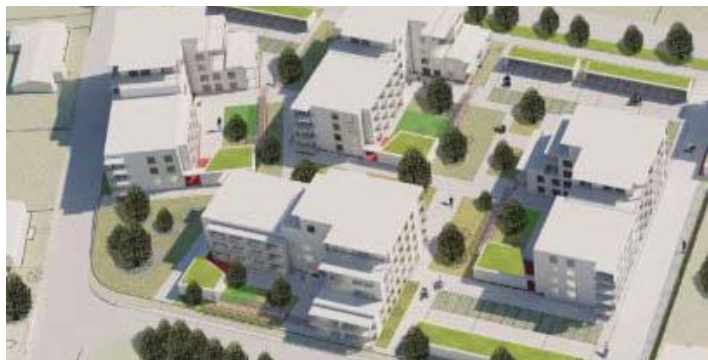
Havainnekuvasa uusi Savonkedonkadun kaava näyttää kovin raskaalta.

Kaavanmuutoksessa tontin rakennusoikeutta on kasvatettu 5976 k-m2 > 10000 k-m2 eli 76% eikä 40% kuten asemakaavaselostuksessa kerrotaan. RAIMO OLLILA