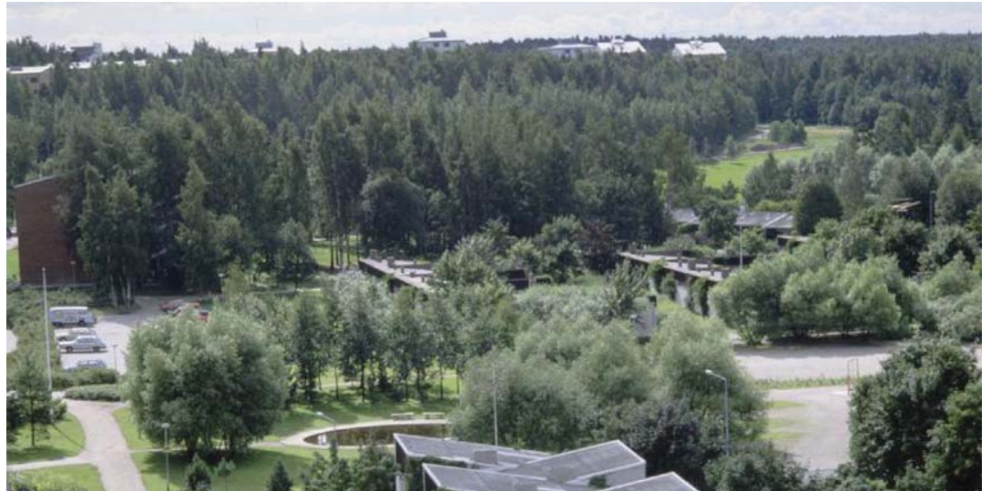
Tapiolan WAU arkkitehtuuria -80 luvulla. Väljyys oli arvo, nyt Turku tiivistää asumisen kerrostalokasarmeihin.